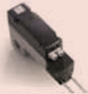
Motor 380 V