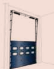
S4 Ray sistemi