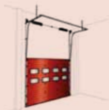
S3 Ray sistemi